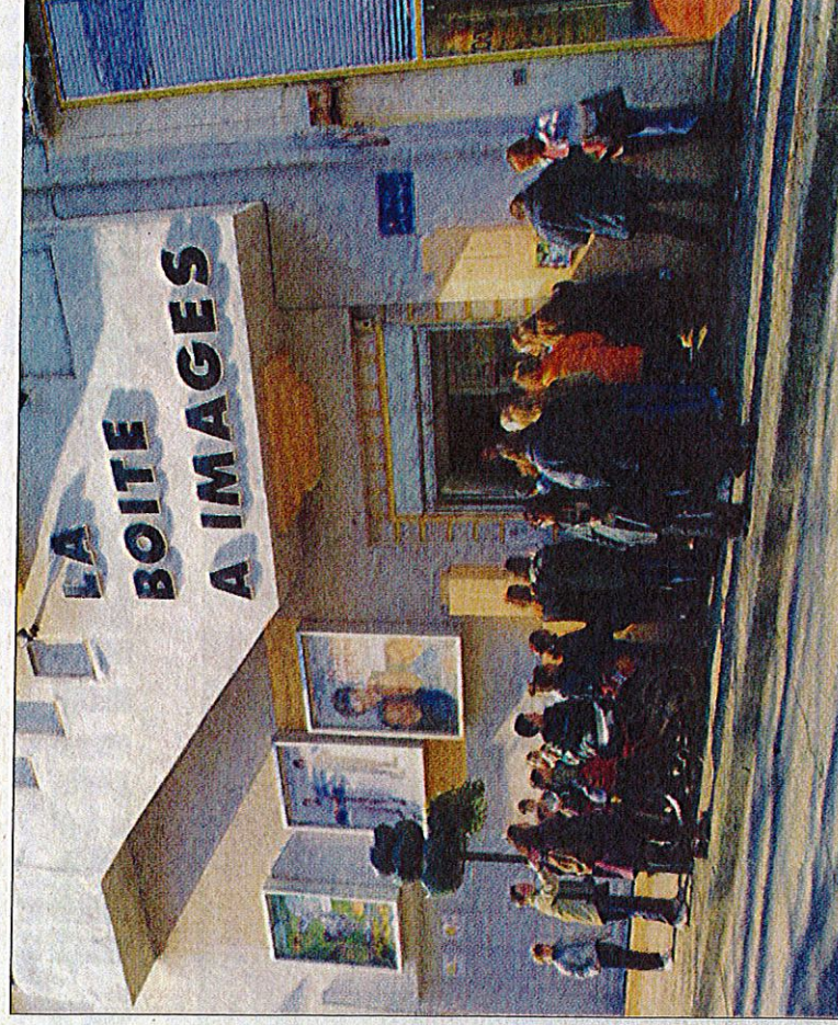
Pour le premier ciné débat organisé par l'association brignolaise Le Possible, le film choisi est « Qu'est-ce qu'on attend ? ».

Vendredi à 20 heures à La boîte à images. Tarif : 6 euros.